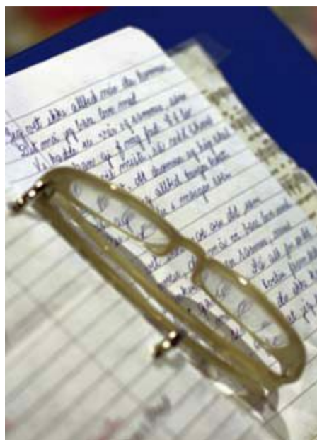
HUSKELAPP | Med seg har hun en perm med sangtekster og stikkord til de mange hundre vitsene hun har på lager.