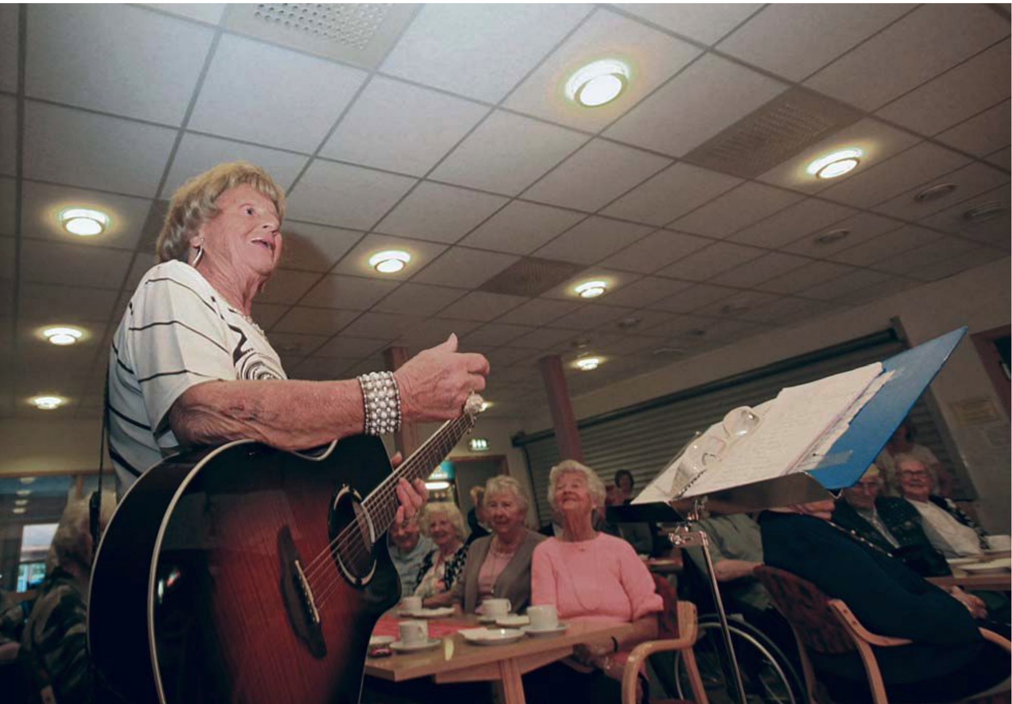
'a GT-Sara. Er 88 år og har alt intakt, sier artisten når hun introduserer seg for publikum.

til å strømme i groveste retning. Men med hennes lune hedmarksdialekt og høye alder blir det verken ekkelt eller vulgært.