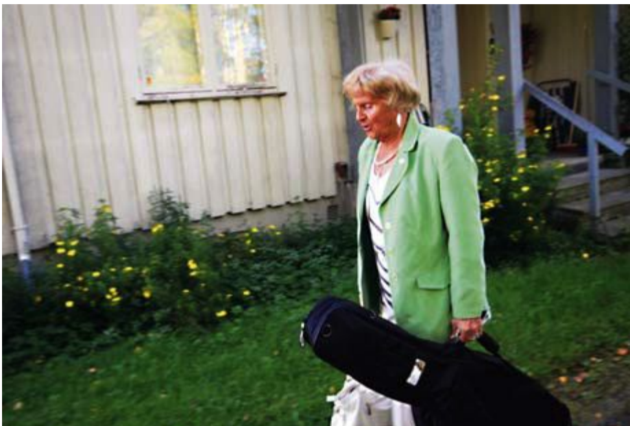
AVREISE | Artisten er nypyntet og klar for oppdrag på Kløfta bo- og aktivitetssenter. – Humoren har reddet helsa, for å bli sittende inne alene ville vært et mareritt for meg, sier hun.